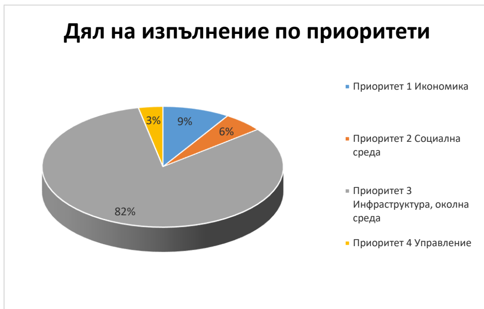
Фигура 2. Разпределение на финансовите средства по приоритети за отчетния период